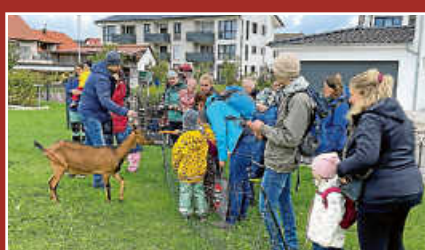
Wanderung der Familiengruppe Seite 11