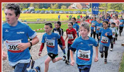
Realschule erfolgreich beim Fossiliuslauf Seite 6