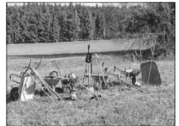
Jetzt fehlen nur noch die Helfer!

Dieses Jahr führen wir auf „Kehlen beim Weißen Kreuz“ und „Vorm Lemberg“ wieder unsere Landschafts-Pflegeaktion durch. Hierbei geht es um den Erhalt der seltenen Pflanzenwelt und um die Verhinderung der Verbuschung dieses Gebietes. Auf die tatkräftige Unterstützung unserer Mitglieder und aller Naturverbundenen sind wir hierbei angewiesen – nur gemeinsam sind wir stark!!