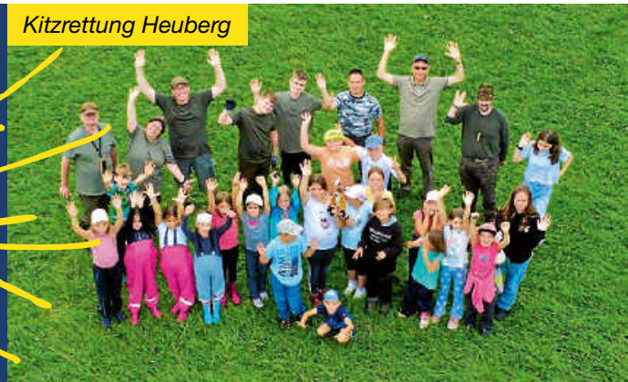
Obst- und Gartenbauverein