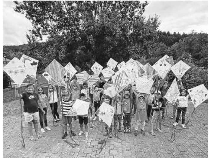
Drachenbasteln beim OGV