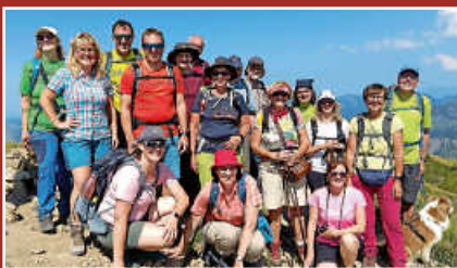
Bergtour Schwäbischer Albverein Seite 14