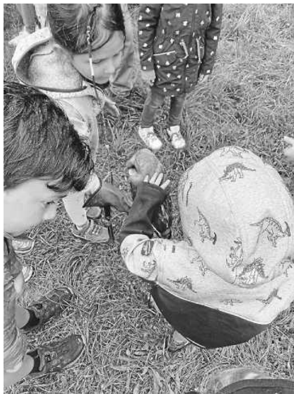
Die Kinder durften die Tiere streicheln.