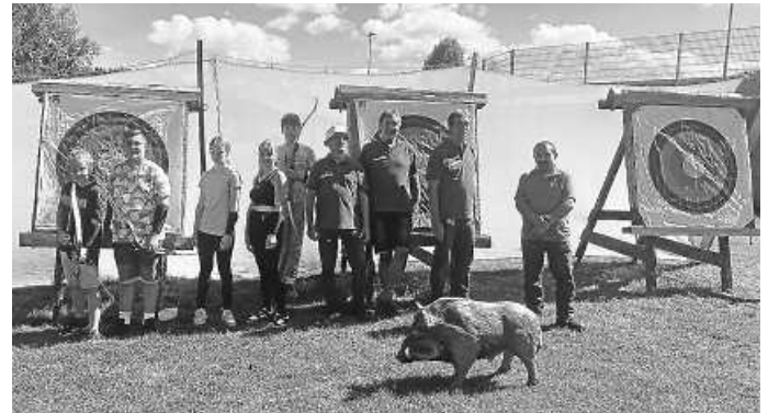
Kinderferienprogramm BSC-Gosheim e.V.

Es war ein schöner und lehrreicher Samstagvormittag auf unserem Bogensportgelände im „Weiher“. /hm, OSM.