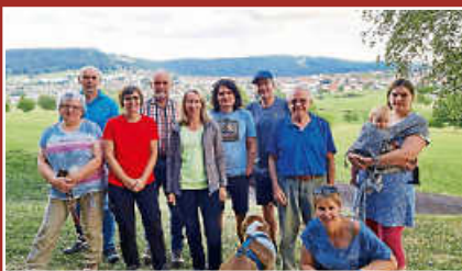
Abendwanderung des Schwäbischen Albvereins Seite 12