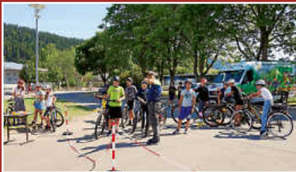
Radfahrtraining der Klasse 5 und 6 des Gymnasiums Gosheim-Wehingen Seite 6