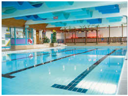
Jurabadteam sucht Verstärkung Seite 4