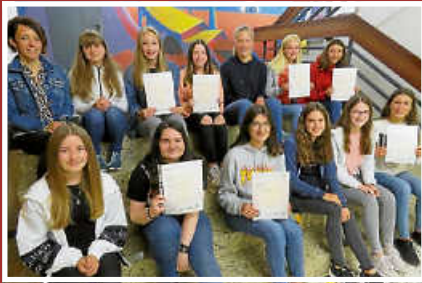
Realschüler erhalten Cambridge- und DELF-Zertifikate Seite 5