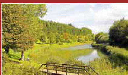
Sommerfest des Angelsportvereins am 14.07.2019 Seite 10