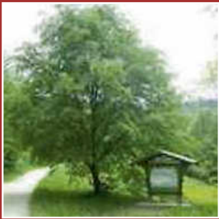
Einladung des Obst- und Gartenbauvereins zum Kräuterspaziergang Seite 8