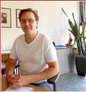
Neuer technischer Leiter der Gemeinde Gosheim Seite 3