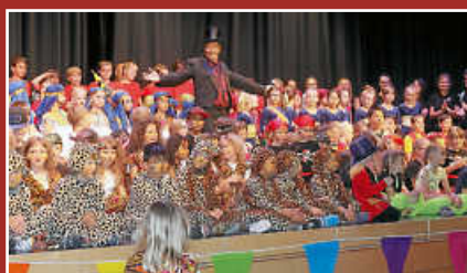
Die Schüler der Juraschule beim Zirkusprojekt Seite 5