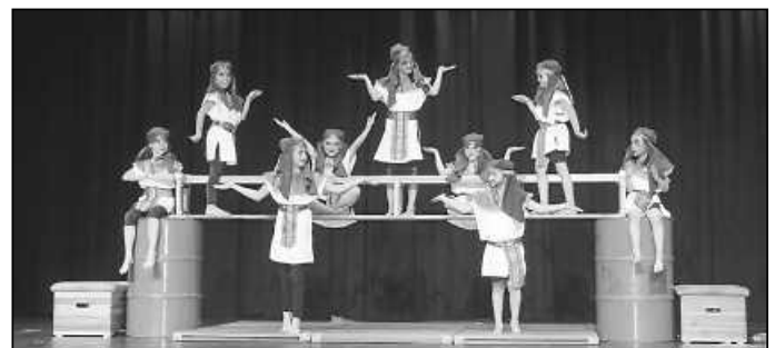
Juraschüler feiern mitreißendes Zirkusprojekt