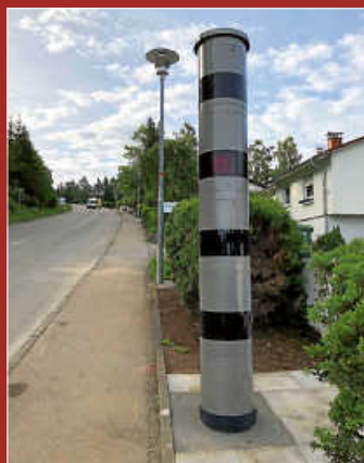
Stationäre Geschwindigkeitsmessanlage in der Heubergstraße installiert. Seite 2