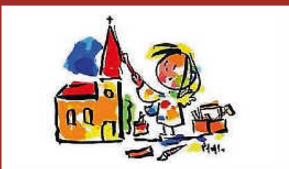
Schülergottesdienste starten wieder Seite 6