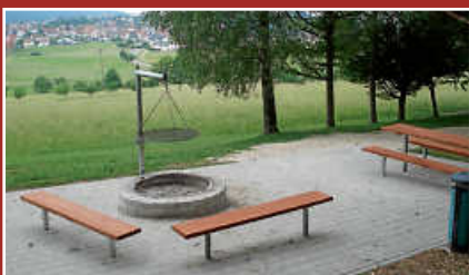
Benutzung öffentlicher Grill- plätze in Gosheim Seite 3