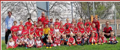
Bambini & F-Jugend Spieltag in Gosheim