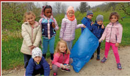
Evang. Johannes-Kindergarten hilft bei Dorfputzete

Mit der Sanierung des Vereinszentrums und dem damit ggfs. verbundenen Neubau eines Bürgersaals befindet sich eine kommunale Erneuerungsmaßnahme in der Planungsphase.