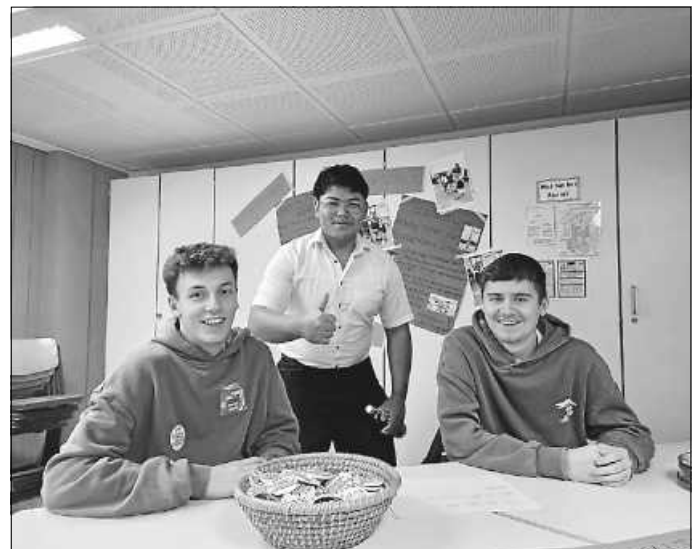
Die SMV stellt sich den Besuchern vor.

Bewirtet hatte auch dieses Jahr der Abiturjahrgang mit Kuchen und Getränken. Außer den Schülern hatte aber auch das Schulgebäude neues zu bieten, was Besuchern aufgefallen war, die nicht das erste Mal da waren. Ein nigelnagelneu eingerichteter, gemütlicher Aufenthaltsraum lädt die Schüler mittlerweile zum Verweilen ein, beispielsweise in den Mittagspausen.