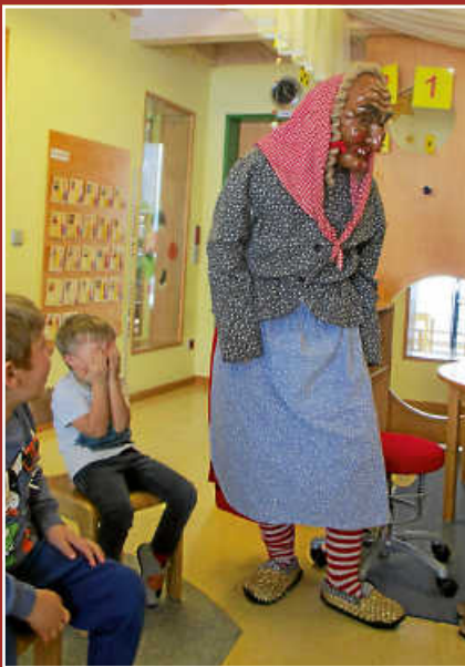
Fasnacht in der Villa Kunterbunt Seite 6