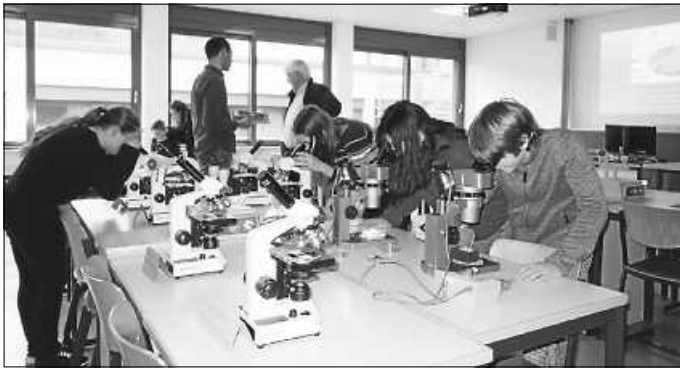
Präsentation der Fachschaft Biologie im Jahr 2020 beim letzten Tag der offenen Tür, der als Präsenzveranstaltung durchgeführt werden konnte.