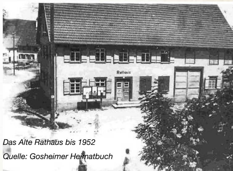
Das Alte Rathaus bis 1952