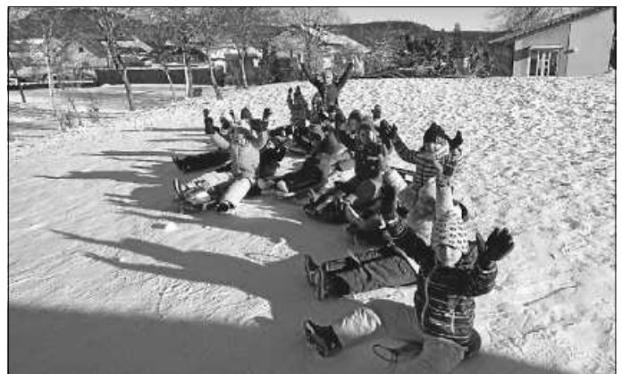
Viel Spaß hatten die Kinder am Rodelhang