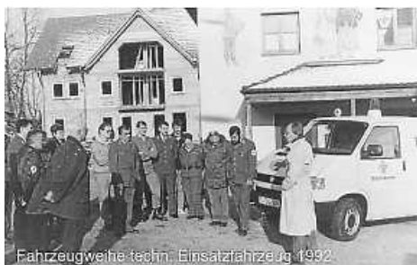
Fahrzeugweihetechn. Einsatzfahrzeug 1962