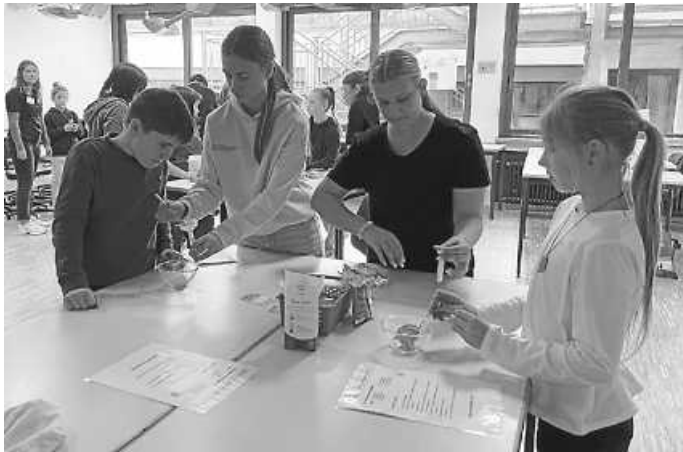
Beim Brausemischen haben die Schüler viel Spaß

Das Kollegium und die Schulleitung der Realschule freute sich, dass die Besucher so zahlreich erschienen sind und für die verschiedenen Angebote großes Interesse gezeigt haben.