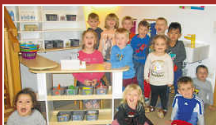
Neuer Kaufladen im Johannes-Kindergarten Seite 6