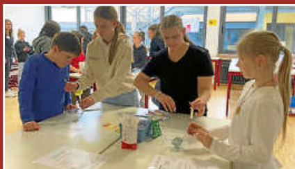
Tag der offenen Tür an der Realschule Gosheim-Wehingen Seite 7