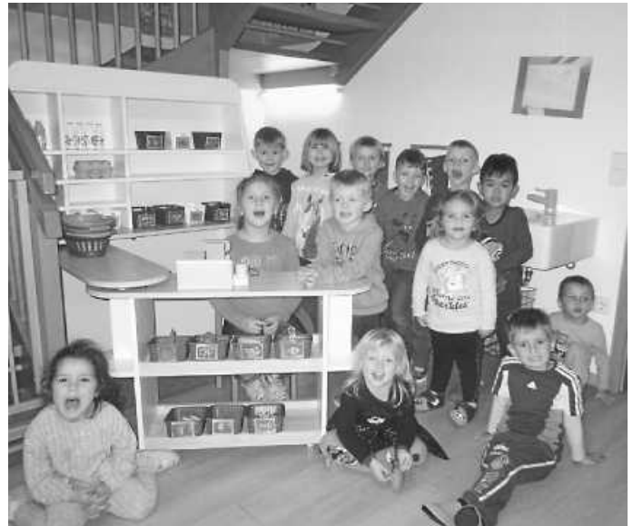
Der neue Kaufladen ist endlich da

Viele Grüße aus dem Johannes-Kindergarten!