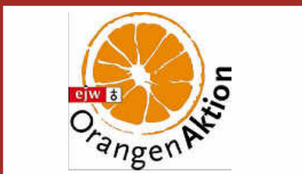
Orangen Aktion Seite 10