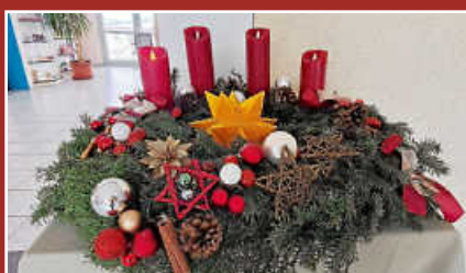
Einladung Adventsnachmittag Seite 6