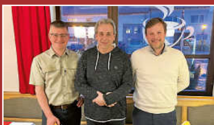
Verabschiedung Waldarbeiter Reez Seite 3