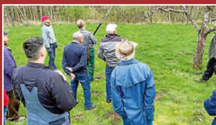
Schnittkurs vom Obst- und Gartenbauverein Seite 12