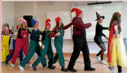
Tag der offenen Tür im Gymnasium Gosheim-Wehingen Seite 9