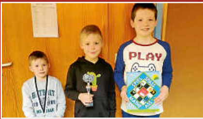
Schachjugend beim Grand-Prix-Turnier in Rottweil Seite 17