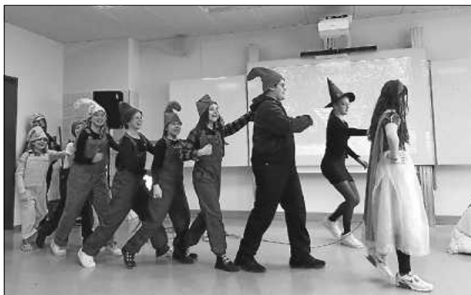
Vorführung modernes Märchentheater

Ein Event, das alle Gäste versammelte, war das moderne Märchentheater. Schüler verschiedener Jahrgangsstufen brachten ein Stück auf die Bühne, das altbekannte Märchenfiguren von einer überraschend modernen Seite zeigte und warb damit unter den zukünftigen Fünftklässlern um neue Mitglieder für die Theater-AG der Schule. Für das leibliche Wohl sorgte der Abiturjahrgang mit Kaffee und Kuchen aber auch die Französisch-Fachschaft mit Crêpes.