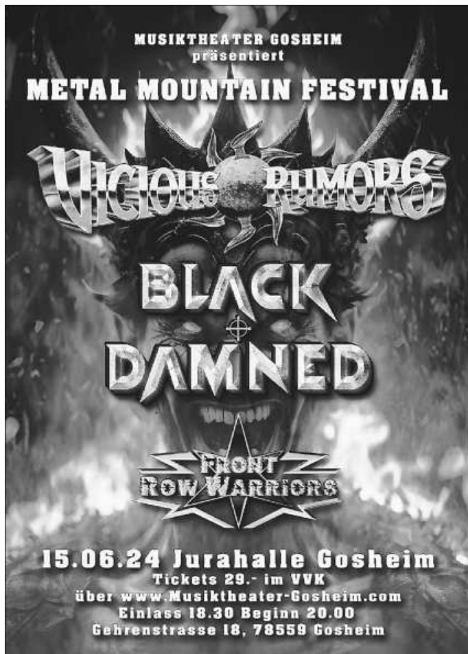
Plakat: Musiktheater Gosheim e.V.